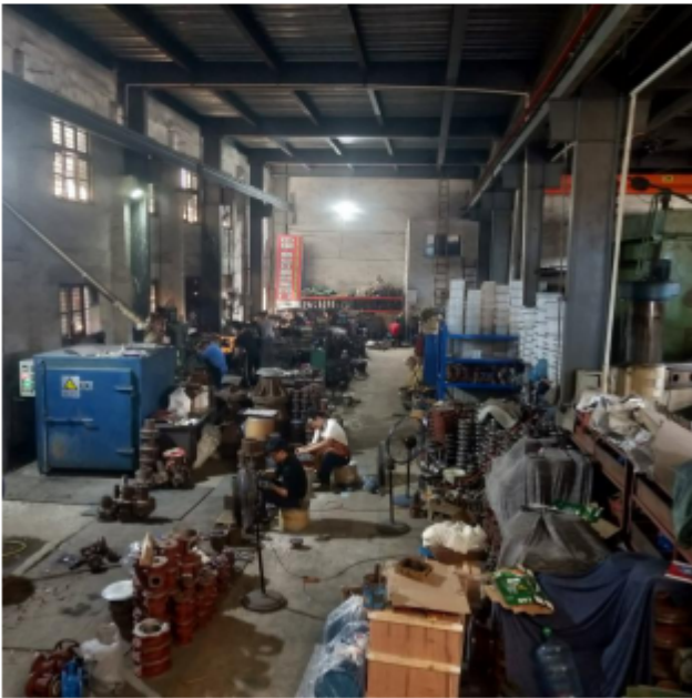
7, 衬氟阀门生产车间