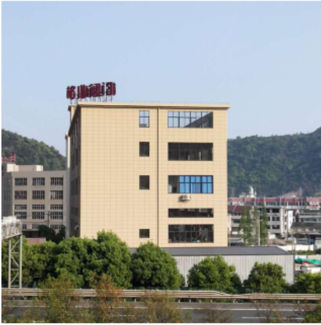
1, 格业阀门厂房外景